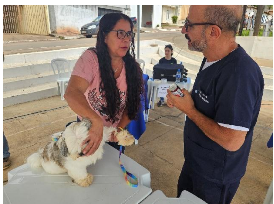
Orientações após consulta Autoria: Carolina Rodrigues Bordignon Data: 26/06/2024