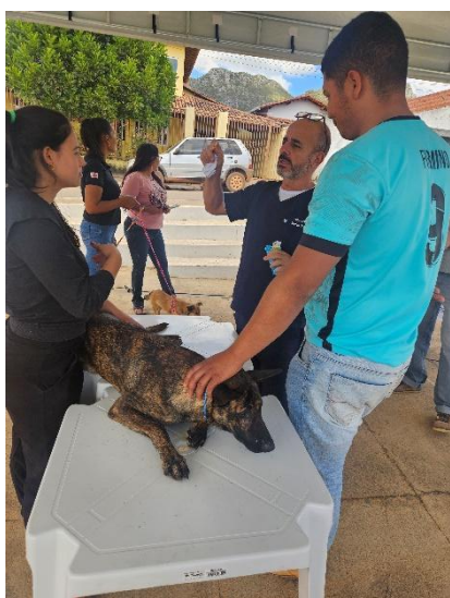
Consulta e orientações Autoria: Carolina Rodrigues Bordignon