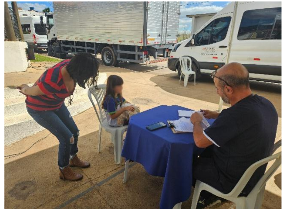
Atendimento - anamnese Autoria: Carolina Rodrigues Bordignon Data: 26/06/2024