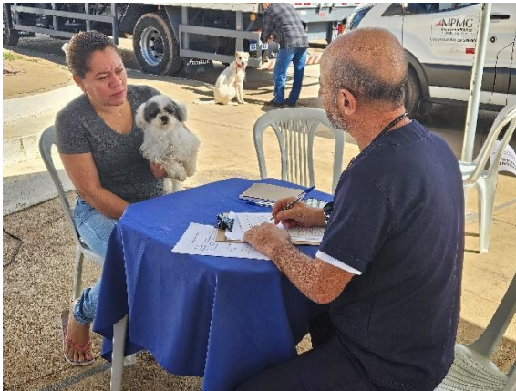
Atendimento - anamnese Autoria: Carolina Rodrigues Bordignon Data: 26/06/2024