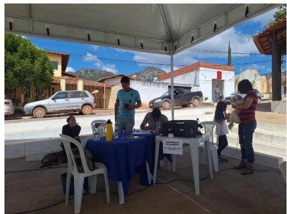
Checagem de cadastro Autoria: Luísa Mosqueira Data: 26/06/2024