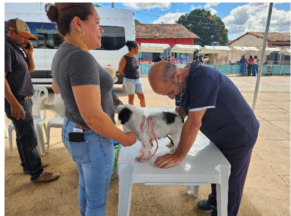
Atendimento veterinário Data: 26/06/2024