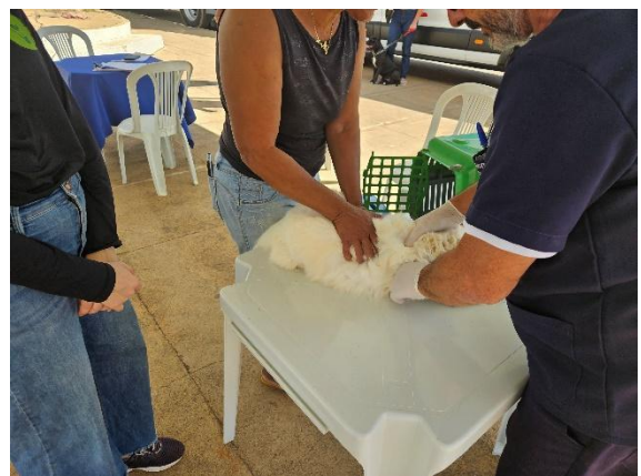
Atendimento veterinário Data: 26/06/2024