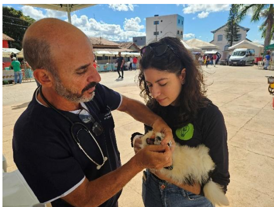
Atendimento veterinário – aplicação de medicação Data: 26/06/2024