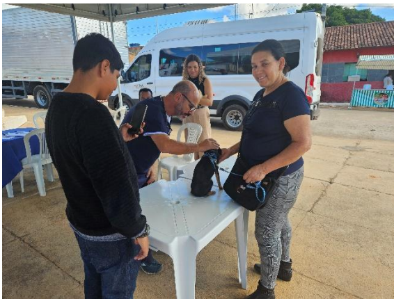
Atendimento veterinário Autoria: Carolina Rodrigues Bordignon Data: 26/06/2024

Após a finalização do atendimento, o tutor é convidado a preencher um formulário de avaliação da consulta, respondendo perguntas sobre o atendimento na recepção, tratamento do animal em relação a abordagem, contenção e cuidados e avaliação das orientações fornecidas, como clareza, conteúdo e apresentação.