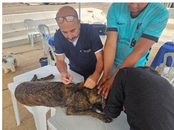
Atendimento veterinário – aplicação de medicação Data: 26/06/2024