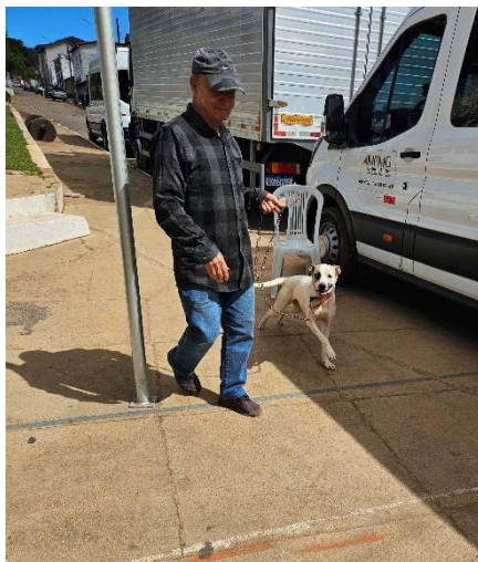
Tutor com animal aguardando consulta Data: 26/06/2024