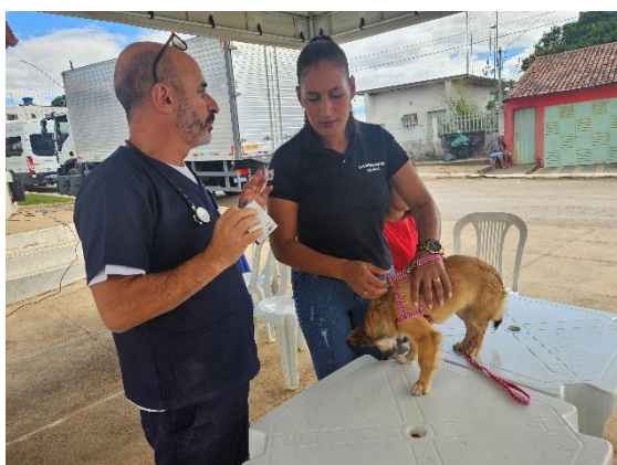
Orientações após consulta Autoria: Carolina Rodrigues Bordignon Data: 26/06/2024