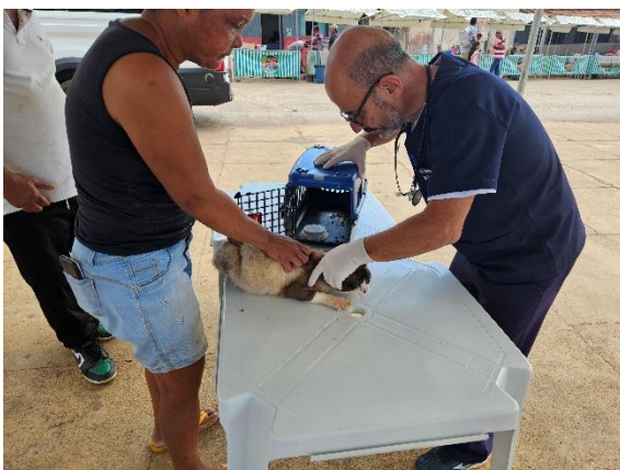
Atendimento veterinário Data: 26/06/2024